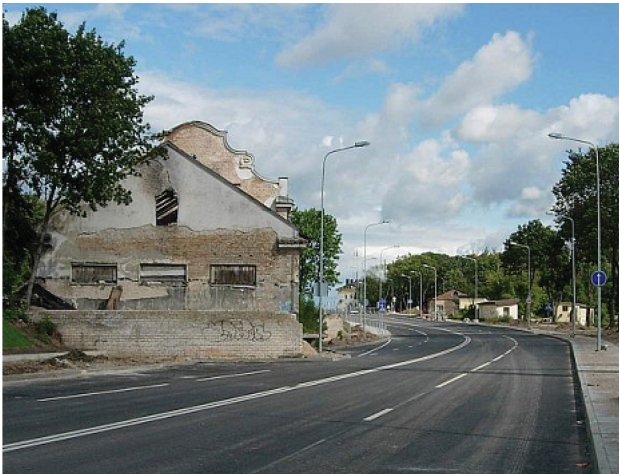
3 pav. Apleisto namo – trukdžio – vaizdas pietinio Vilniaus Senamiesčio apvažiavimo kraštovaizdyje. Akivaizdus paveldo praradimo pavyzdys ir paveldotvarkos teisinės sistemos neveiklumo įrodymas

Fig. 3. Abandoned house in the location of the Southern Detour of Vilnius Old town landscape view. Obvious example of heritage loss and inactivity of legal system of the heritage protection