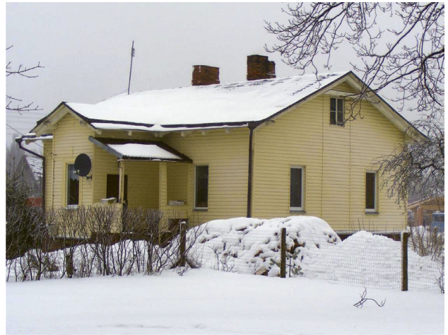
4 pav. Neatpažįstamai ir negrįžtamai pakeistas XIX a. pab. medis gyvenamasis namas Ignalinoje. Tik labai prityrusi specialisto akis dar galėtų įžiūrėti jo tikrąją vertę

Jau nekalbant apie Lietuvos dvarus, kuriems reikia kaip oro tvaraus postūmio, ekonominėje leksikoje vadinamo „besiridenančia sniego gniūžte“, ir subalansuotą panaudojimo pasiūlymų paketo įvairovės.