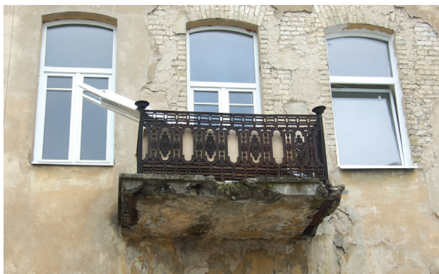
1 pav. Simptomatinis paveldo apsaugos ir tvarkybos atspindys, rodantis požiūrį į substanciją ir naujadarų intarpus

Čia yra vėlgi vienas šio straipsnio raktažodžio virsmų, tik mažesniu masteliu. Holistinis požiūris – tai yra toks